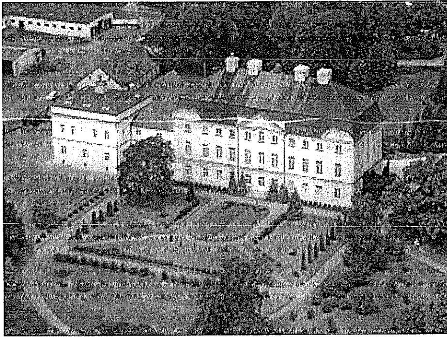
Fot. Pałac w Ciężeniu