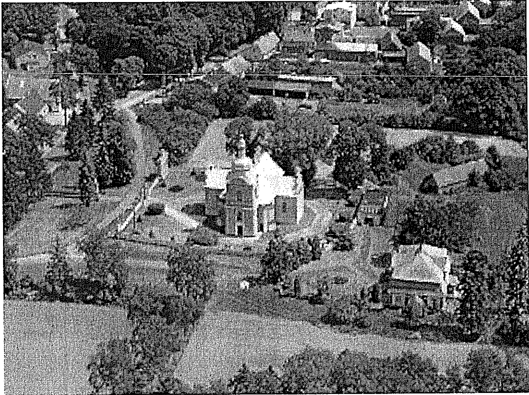
Fot. Kościół parafialny w Ciężeniu

został przebudowany na styl barokowy. Wpisany został wraz z dzwonnica z połowy XIX w. i plebanią z 2 poł. XVIII w do rejestru zabytków KOBiDZ pod numerem 102 w dniu 31 maja 1968 r.