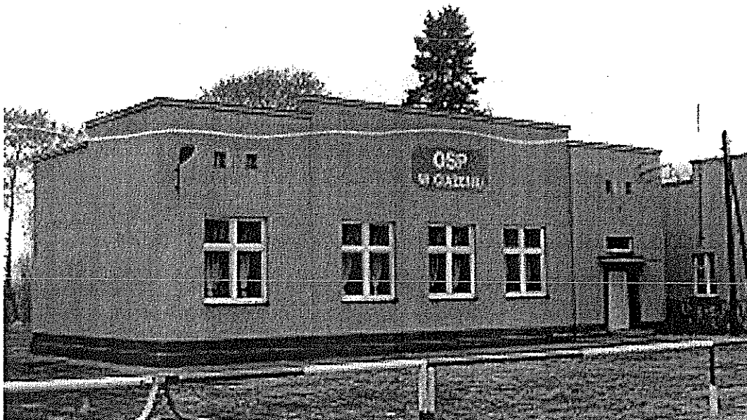
Fot. Sala OSP w Ciężeniu