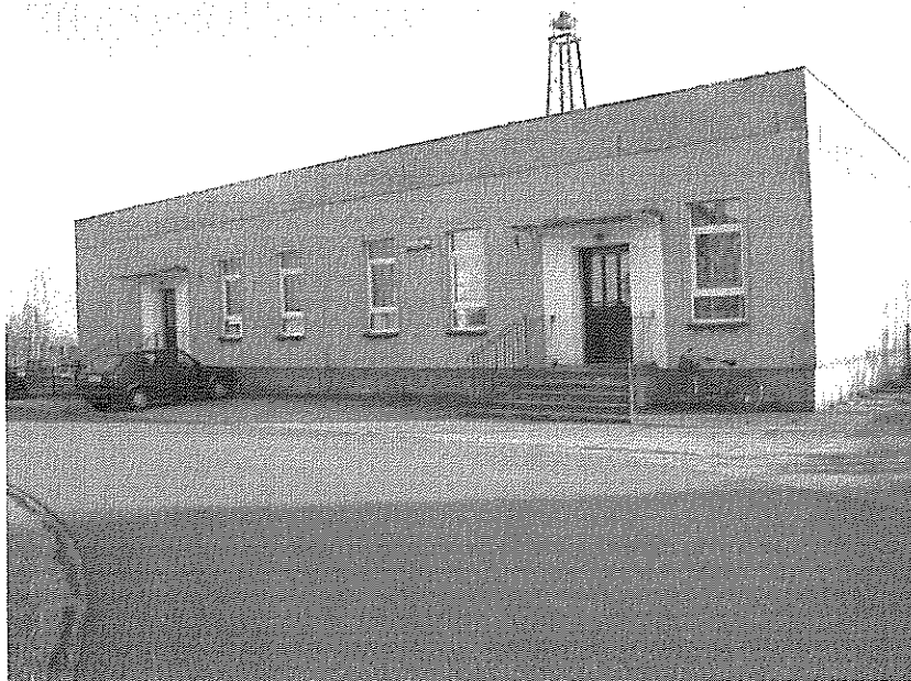
fot. sala Ochotniczej Straży Pożarnej w Dolanach.